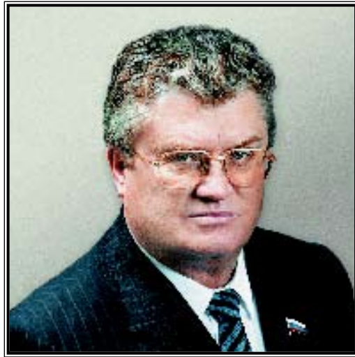
ЗАМЕСТИТЕЛЬ ПРЕДСЕДАТЕЛЯ ГОСУДАРСТВЕННОЙ ДУМЫ ФЕДЕРАЛЬНОГО СОБРАНИЯ РОССИЙСКОЙ ФЕДЕРАЦИИ Валерий Афонасьевич Язев

На протяжении последних трех столетий наш мир претерпевает бурную энергетическую эволюцию. Стремительно увеличивается количество энергии, используемой человечеством в различных формах, в том числе и в форме взрыва. Неизменным остается одно – всю энергию, которую мы берем у природы, ей мы и возвращаем. Природа предоставляет нам энергию в пользование и берет с нас за это справедливый процент, а порой и большие штрафы. Заглядывая в будущее, хотелось бы правильно выбрать вектор энергетической эволюции, оценить – насколько велик кредит энергии, который может быть получен человечеством, и как его лучше использовать.