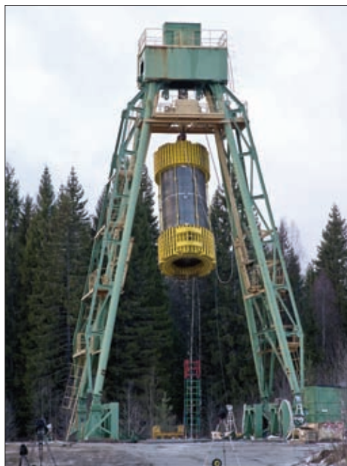
ТУК-146 ПЕРЕД БРОСКОВЫМ ИСПЫТАНИЕМ