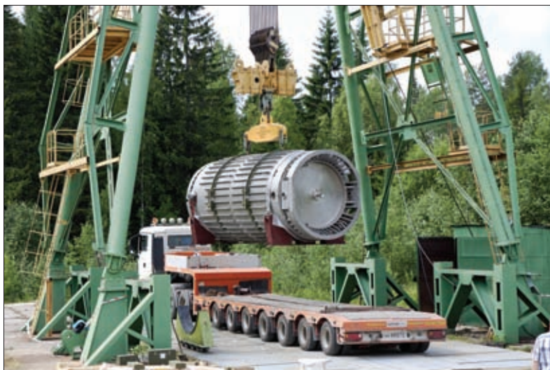
ПОДГОТОВКА ТРАНСПОРТНОГО УПАКОВОЧНОГО КОМПЛЕКТА К ИСПЫТАНИЯМ

диационной защиты при таких авариях. Данная концепция и соответствующие международные и национальные правила также предусматривают, что при ограниченном количестве и небольшой потенциальной опасности перевозимых РМ могут использоваться упаковочные комплекты, не рассчитанные на аварийные условия.