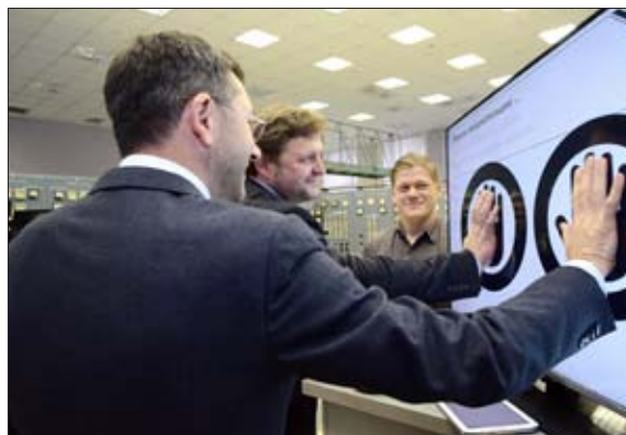
ПУСК ТУРБОГЕНЕРАТОРА НА КИРОВСКОЙ ТЭЦ-4 В ДЕКАБРЕ 2014 ГОДА