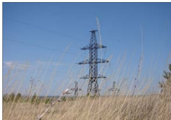
ВОЗДУШНЫЕ ЛИНИИ ЭЛЕКТРОПЕРЕДАЧИ 110 КВ

В настоящее время природный газ подается в населенные пункты 14 из 39 муниципальных районов и в 3 из 6 городских округов.