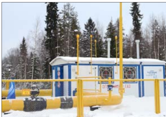
НОВАЯ ГАЗОВАЯ ПОДСТАНЦИЯ В ЮРЬЯНСКОМ РАЙОНЕ