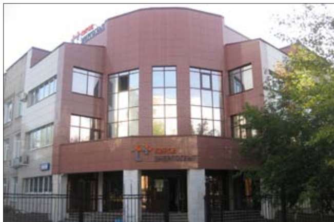
ЗДАНИЕ КИРОВСКОГО ФИЛИАЛА «ЭНЕРГОСБЫТ ПЛЮС»