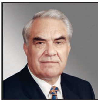
ПРЕЗИДЕНТ СОЮЗА НЕФТЕГАЗОПРОМЫШЛЕННИКОВ РОССИИ Геннадий Иосифович Шмаль