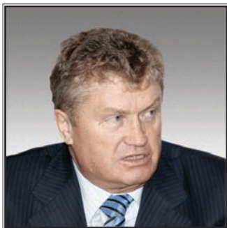
ЗАМЕСТИТЕЛЬ ПРЕДСЕДАТЕЛЯ ГОСУДАРСТВЕННОЙ ДУМЫ ФЕДЕРАЛЬНОГО СОБРАНИЯ РОССИЙСКОЙ ФЕДЕРАЦИИ, ПРЕЗИДЕНТ РОССИЙСКОГО ГАЗОВОГО ОБЩЕСТВА Валерий Афонасьевич Язев