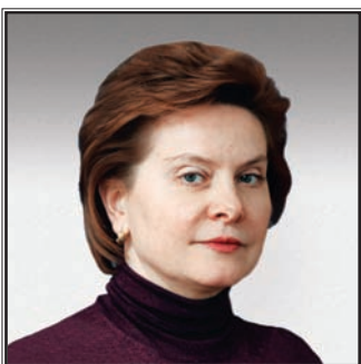
ГУБЕРНАТОР ХАНТЫ-МАНСИЙСКОГО АВТОНОМНОГО ОКРУГА – ЮГРЫ Наталья Владимировна Комарова