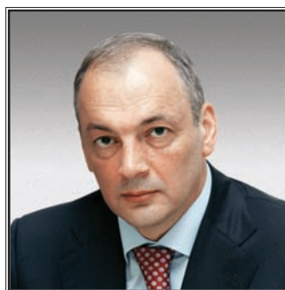
ПРЕЗИДЕНТ РЕСПУБЛИКИ ДАГЕСТАН Магомедсалам Магомедалиевич Магомедов