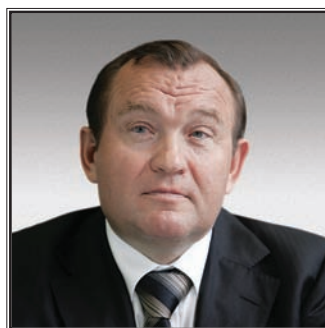
ЗАМЕСТИТЕЛЬ МЭРА МОСКВЫ В ПРАВИТЕЛЬСТВЕ МОСКВЫ Петр Павлович Бирюков