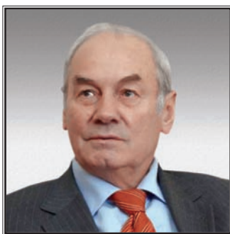
ПРЕЗИДЕНТ АКАДЕМИИ ГЕОПОЛИТИЧЕСКИХ ПРОБЛЕМ Леонид Григорьевич Ивашов