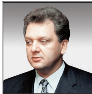
МИНИСТР ПРОМЫШЛЕННОСТИ И ТОРГОВЛИ РОССИЙСКОЙ ФЕДЕРАЦИИ Виктор Борисович Христенко