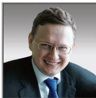
ДИРЕКТОР ИНСТИТУТА ПРОБЛЕМ ГЛОБАЛИЗАЦИИ Михаил Геннадьевич Делягин