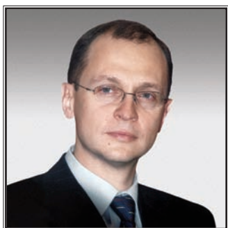
ГЕНЕРАЛЬНЫЙ ДИРЕКТОР ГОСУДАРСТВЕННОЙ КОРПОРАЦИИ ПО АТОМНОЙ ЭНЕРГИИ «РОСАТОМ» Сергей Владиленич Кириенко