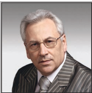
ПРЕДСЕДАТЕЛЬ КОМИТЕТА ГОСУДАРСТВЕННОЙ ДУМЫ ПО ЭНЕРГЕТИКЕ Юрий Александрович Липатов