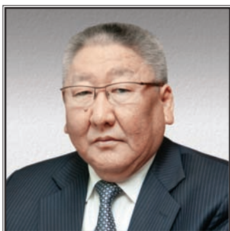
ПРЕЗИДЕНТ РЕСПУБЛИКИ САХА (ЯКУТИЯ) Егор Афонасьевич Борисов