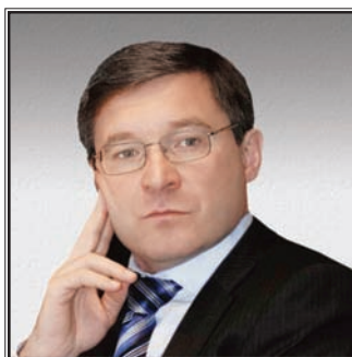
ГУБЕРНАТОР ТЮМЕНСКОЙ ОБЛАСТИ Владимир Владимирович Якушев