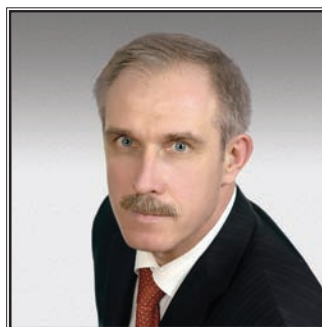
ГУБЕРНАТОР УЛЬЯНОВСКОЙ ОБЛАСТИ Сергей Иванович Морозов