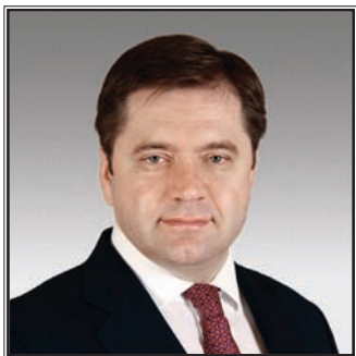
МИНИСТР ЭНЕРГЕТИКИ РОССИЙСКОЙ ФЕДЕРАЦИИ Сергей Иванович Шматко