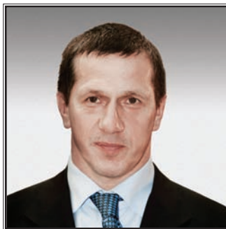
МИНИСТР ПРИРОДНЫХ РЕСУРСОВ И ЭКОЛОГИИ РОССИЙСКОЙ ФЕДЕРАЦИИ Юрий Петрович Трутнев