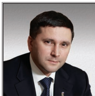
ГУБЕРНАТОР ЯМАЛО-НЕНЕЦКОГО АВТОНОМНОГО ОКРУГА Дмитрий Николаевич Кобылкин