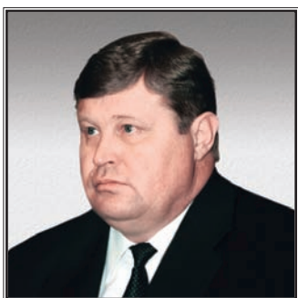
ПОЛНОМОЧНЫЙ ПРЕДСТАВИТЕЛЬ ПРЕЗИДЕНТА РОССИЙСКОЙ ФЕДЕРАЦИИ В ЮЖНОМ ФЕДЕРАЛЬНОМ ОКРУГЕ Владимир Васильевич Устинов