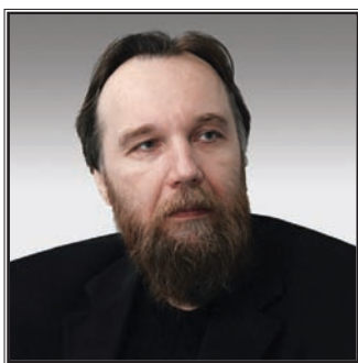
ПРЕДСЕДАТЕЛЬ ЕВРАЗИЙСКОГО КОМИТЕТА МЕЖДУНАРОДНОГО «ЕВРАЗИЙСКОГО ДВИЖЕНИЯ», ДИРЕКТОР ФОНДА «ЦЕНТР ГЕОПОЛИТИЧЕСКИХ ЭКСПЕРТИЗ» Александр Гельевич Дугин