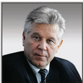
ГУБЕРНАТОР САРАТОВСКОЙ ОБЛАСТИ Павел Леонидович Ипатов