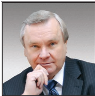
ПРЕДСЕДАТЕЛЬ ИСПОЛКОМА ЭЛЕКТРОЭНЕРГЕТИЧЕСКОГО СОВЕТА СТРАН СОДРУЖЕСТВА НЕЗАВИСИМЫХ ГОСУДАРСТВ Евгений Семенович Мишук