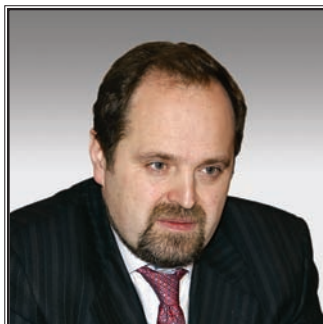
ЗАМЕСТИТЕЛЬ МИНИСТРА ПРИРОДНЫХ РЕСУРСОВ И ЭКОЛОГИИ РОССИЙСКОЙ ФЕДЕРАЦИИ Сергей Ефимович Донской