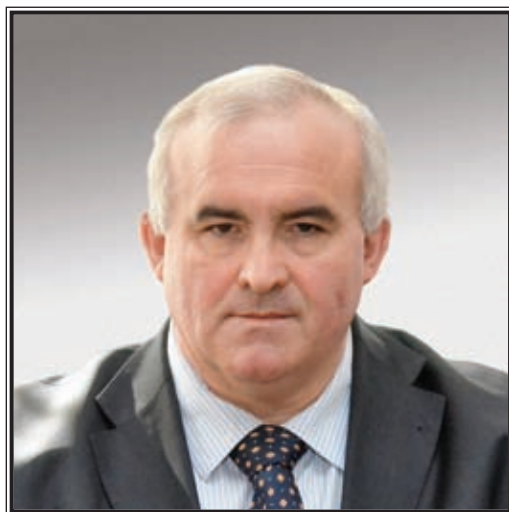
ГУБЕРНАТОР КОСТРОМСКОЙ ОБЛАСТИ Сергей Константинович Ситников

Государственная программа Российской Федерации «Информационное общество (2011–2020 годы)» четко обозначила задачи развития связи и массовых коммуникаций. Это повышение качества жизни граждан и улучшение условий развития бизнеса в информационном обществе, в том числе: развитие сервисов для упрощения процедур взаимодействия общества и государства с использованием информационных и телекоммуникационных технологий; перевод государственных и муниципальных услуг в электронный вид; развитие инфраструктуры доступа к сервисам электронного государства; повышение открытости деятельности органов государственной власти; создание и развитие электронных сервисов в области здравоохранения, жилищно-коммунального хозяйства, образования и науки и т.д.