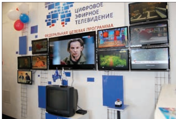
ЛЮБОМУ ПОМОГУТ НАСТРОИТЬ ТЕЛЕВИЗОР НА ЦИФРОВОЕ ВЕЩАНИЕ

АТС в пос. Никольское, г. Нея с применением технологии VDSL. Расширена зона предоставления услуг широкополосного доступа в Интернет по технологии ADSL в сельских населенных пунктах.