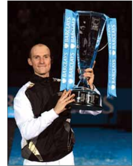
НИКОЛАЙ ДАВЫДЕНКО – ПОБЕДИТЕЛЬ ИТОГОВОГО ЧЕМПИОНАТА АТР 2009 ГОДА

Кроме того, 42 млрд. рублей необходимы для создания материально-технической базы, без которой нельзя гарантировать полноценную подготовку талантливых теннисистов.