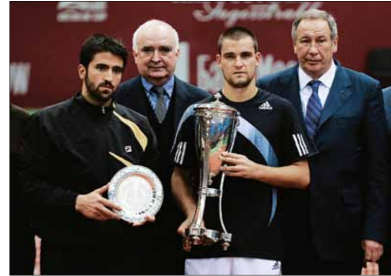
МИХАИЛ ЮЖНЫЙ – ПОБЕДИТЕЛЬ КУБКА КРЕМЛЯ 2009 ГОДА