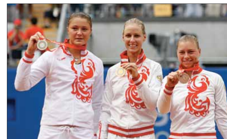
РОССИЙСКИЙ ПЬЕДЕСТАЛ НА ОЛИМПИАДЕ В ПЕКИНЕ