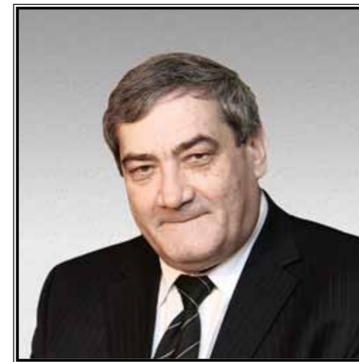
ПРЕЗИДЕНТ РЕСПУБЛИКИ САХА (ЯКУТИЯ) Вячеслав Анатольевич Штыров