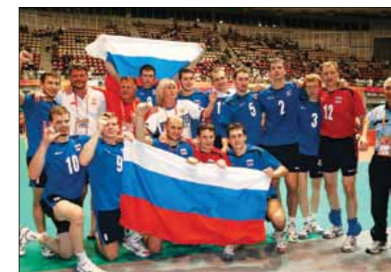
ЧЕМПИОН СУРДИМПИЙСКИХ ИГР 2009 ГОДА В ТАЙБЭЕ СБОРНАЯ РОССИИ ПО ВОЛЕЙБОЛУ