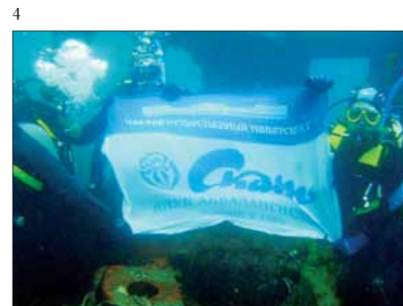
4 СПОРТИВНЫЙ КЛУБ АКВАЛАНГИСТОВ ТОМСКА «СКАТ»