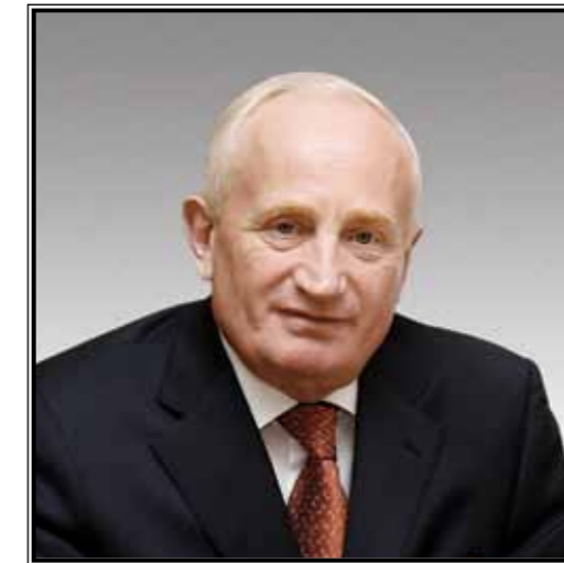
ГУБЕРНАТОР ТОМСКОЙ ОБЛАСТИ Виктор Мельхиорович Кресс

Томск – сибирский студенческий город. История студенческого спорта в Томске берет начало с конца XIX века – именно тогда в городе появились первые спортивные кружки, объединившие незначительную часть населения, в основном студенческую молодежь. Их появление пробуждало и повышало интерес молодежи к занятиям физической культурой. Это были первые предпосылки к последующему развитию студенческого физкультурно-спортивного движения.