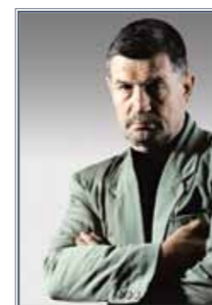
ПОЧЕТНЫЙ ПРЕЗИДЕНТ ВСЕРОССИЙСКОЙ ФЕДЕРАЦИИ СЭН'Э Тадеуш Рафаилович Касьянов

Кто хоть немного разбирается в законах развития, понимает, что путь от простого к сложному, от примитива к совершенству – это и есть путь развития. Вне зависимости от того, о чем идет речь в данном случае: техническом прогрессе, развитии животного мира или человеческого общества. Обратный же процесс, движение от совершенства к примитиву, называется деградацией или регрессом. Применительно к спорту в целом прослеживается явное усложнение и в части большей скрупулезности в регламентации правил, тактико-технических аспектах, инвентаре и оборудовании, то есть большой спорт, в массе своей, развивается, прогрессирует. К сожалению, этого же нельзя с уверенностью сказать о единоборствах.