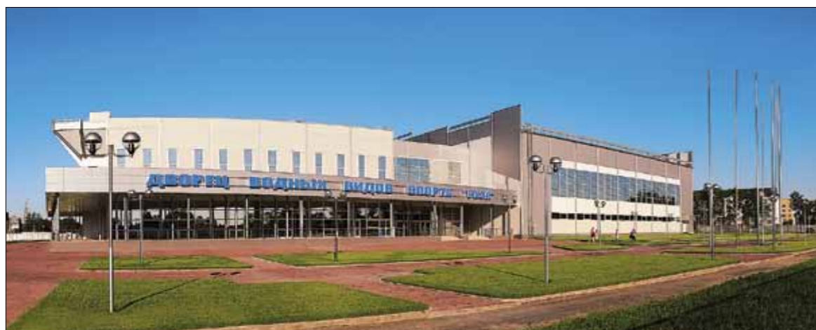
ДВОРЕЦ ВОДНЫХ ВИДОВ СПОРТА «РУЗА»