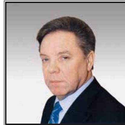
ГУБЕРНАТОР МОСКОВСКОЙ ОБЛАСТИ Борис Всеволодович Громов