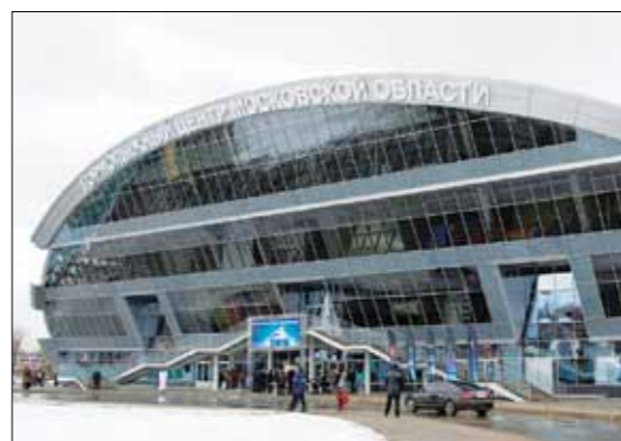
ГОРНОЛЫЖНЫЙ ЦЕНТР МОСКОВСКОЙ ОБЛАСТИ «СНЕЖКОМ»