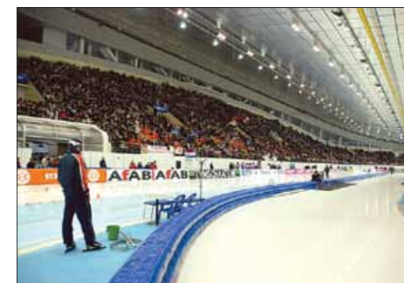
КОНЬКОБЕЖНЫЙ ЦЕНТР «КОЛОМНА» (Г. КОЛОМНА)