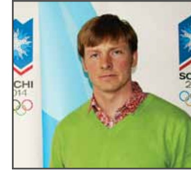
Александр Юрьевич Зубков БОБСЛЕЙ БРОНЗОВЫЙ ПРИЗЕР В СОСТАВЕ ЭКИПАЖА ДВОЙКИ

– Медаль ордена «За заслуги перед Отечеством» II степени (5 марта 2010 года) – за большой вклад в развитие физической культуры и спорта, высокие спортивные достижения на Играх XXI Олимпиады 2010 года в Ванкувере. – Заслуженный мастер спорта России.