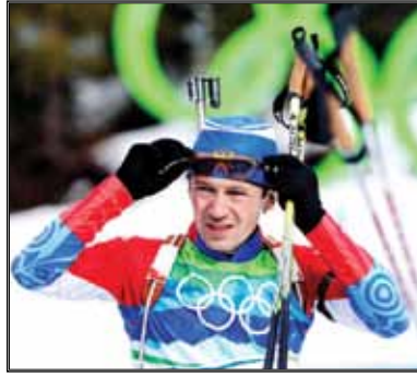
Максим Александрович Чудов БИАТЛОН БРОНЗОВЫЙ ПРИЗЕР В ЭСТАФЕТЕ