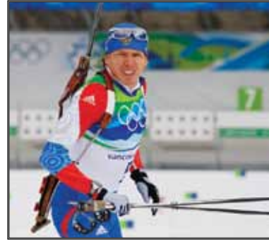
Иван Юрьевич Черезов БИАТЛОН БРОНЗОВЫЙ ПРИЗЕР В ЭСТАФЕТЕ

– Медаль ордена «За заслуги перед Отечеством» II степени (5 марта 2010 года) – за большой вклад в развитие физической культуры и спорта, высокие спортивные достижения на Играх XXI Олимпиады 2010 года в Ванкувере. – Заслуженный мастер спорта России.