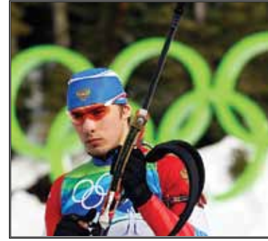
Антон Владимирович Шипулин БИАТЛОН БРОНЗОВЫЙ ПРИЗЕР В ЭСТАФЕТЕ

– Медаль ордена «За заслуги перед Отечеством» II степени (22 февраля 2007 года) – за большой вклад в развитие физической культуры и спорта, высокие спортивные достижения. – Медаль ордена «За заслуги перед Отечеством» I степени (5 марта 2010 года) – за большой вклад в развитие физической культуры и спорта, высокие спортивные достижения на Играх XXI Олимпиады 2010 года в Ванкувере. – Медаль Министерства обороны Российской Федерации «За укрепление боевого содружества». – Заслуженный мастер спорта России.