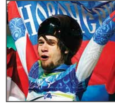
Александр Владимирович Третьяков БОБСЛЕЙ, СКЕЛЕТОН БРОНЗОВЫЙ ПРИЗЕР В СКЕЛЕТОНЕ

Родился 19 апреля 1985 года (Красноярск). Победитель Кубка мира по скелетону сезона 2008/09 года (первый в истории России). Бронзовый призер чемпионата мира 2009 года. Чемпион мира 2008 года среди юниоров. Бронзовый призер Олимпиады-2010 в Ванкувере.