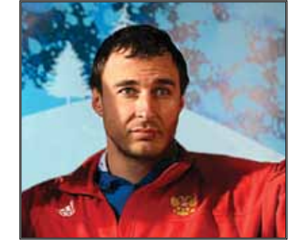
Алексей Иванович Воевода БОБСЛЕЙ БРОНЗОВЫЙ ПРИЗЕР В СОСТАВЕ ЭКИПАЖА ДВОЙКИ

– Орден Дружбы (22 февраля 2007 года) – за большой вклад в развитие физической культуры и спорта, высокие спортивные достижения. – Медаль ордена «За заслуги перед Отечеством» II степени (5 марта 2010 года) – за большой вклад в развитие физической культуры и спорта, высокие спортивные достижения на Играх XXI Олимпиады 2010 года в Ванкувере. – Заслуженный мастер спорта России.