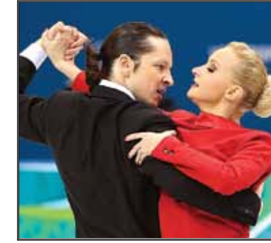
Оксана Александровна Домнина и Максим Андреевич Шабалин

ФИГУРНОЕ КАТАНИЕ БРОНЗОВЫЕ ПРИЗЕРЫ В СПОРТИВНЫХ ТАНЦАХ