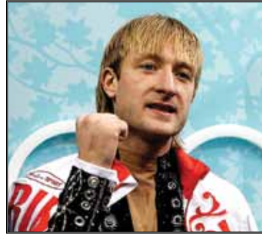
Евгений Викторович Плющенко

– Медаль ордена «За заслуги перед Отечеством» I степени (5 марта 2010 года) – за большой вклад в развитие физической культуры и спорта, высокие спортивные достижения на Играх XXI Олимпиады 2010 года в Ванкувере. – Заслуженный мастер спорта России.