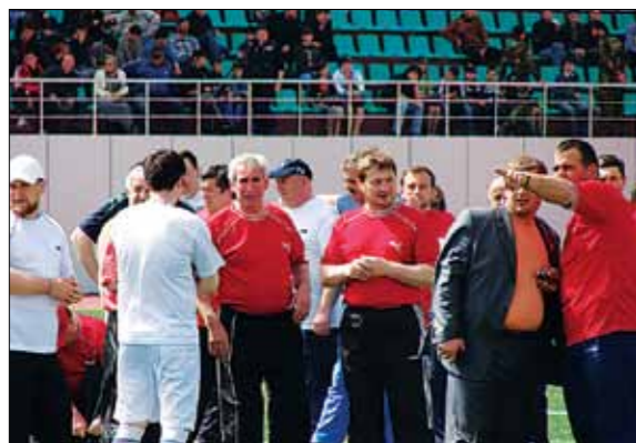
МИНИСТР ФИЗИЧЕСКОЙ КУЛЬТУРЫ, СПОРТА И ТУРИЗМА ЧЕЧЕНСКОЙ РЕСПУБЛИКИ Х.М. АЛХАНОВ, ПРЕДСЕДАТЕЛЬ ПРАВИТЕЛЬСТВА ЧЕЧЕНСКОЙ РЕСПУБЛИКИ О.Х. БАЙСУЛТАНОВ