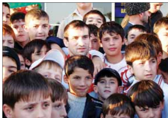
И. АЛБИБЕВ СРЕДИ ЮНЫХ ЛЮБИТЕЛЕЙ СПОРТА

Поэтому обязательными для Чеченской Республики являются своевременное завершение строительства спортивных объектов по Федеральной целевой программе «Социально-экономическое развитие Чеченской Республики на 2008–2012 годы», активное включение строительства объектов массового спорта в Федеральную целевую программу «Развитие физической культуры и спорта в Российской Федерации в 2006–2015 годы», разработка концепции Программы развития физической культуры и спорта Чеченской Республики до 2020 года.