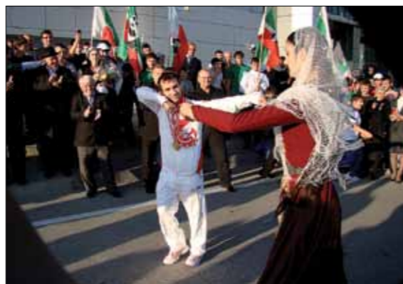
ИСЛАМБЕК АЛЬБИЕВ, ЧЕМПИОН МИРА ПО ГРЕКО-РИМСКОЙ БОРЬБЕ

Восстановлено и построено более 1 тыс. плоскостных сооружений, 400 школьных спортивных залов. За счет внебюджетных источников финансирования построены и введены в эксплуатацию 24 спортивных комплекса. Идет строительство спортивного комплекса имени А.-Х. Кадырова в г. Грозном в составе стадиона на 30 тыс. мест, дворца спорта и других сооружений.