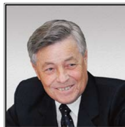
ГУБЕРНАТОР ЧЕЛЯБИНСКОЙ ОБЛАСТИ Петр Иванович Сумин