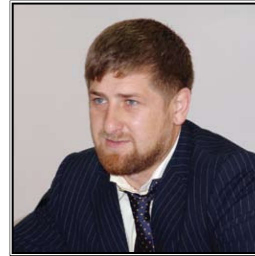
ПРЕЗИДЕНТ ЧЕЧЕНСКОЙ РЕСПУБЛИКИ Рамзан Ахматович Кадыров

Физическая культура и спорт в Чеченской Республике всегда имели свои славные традиции.