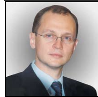
СОПРЕДСЕДАТЕЛЬ РОССИЙСКОГО СОЮЗА БОЕВЫХ ИСКУССТВ Сергей Владиленович Кириенко