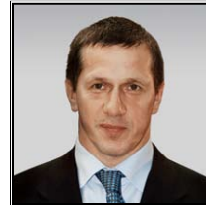
СОПРЕДСЕДАТЕЛЬ РОССИЙСКОГО СОЮЗА БОЕВЫХ ИСКУССТВ Юрий Петрович Трутнев

Российский Союз боевых искусств (РСБИ) был создан 1 июня 2005 года. 22 декабря 2005 года постановлением Олимпийского Собрания Общероссийский союз общественных объединений «Российский Союз боевых искусств» был принят в члены Олимпийского комитета России.