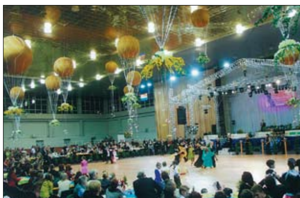
ПЕРВЕНСТВО РОССИИ СРЕДИ ЮНИОРОВ 14–15 ЛЕТ, Г. КАЛИНИНГРАД, 2007 ГОД