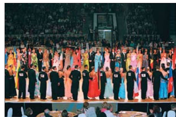
ЦЕРЕМОНИЯ ОТКРЫТИЯ ЧЕМПИОНАТА МИРА ПО ЕВРОПЕЙСКОЙ ПРОГРАММЕ, 27 ОКТЯБРЯ 2007 ГОДА, Г. МОСКВА