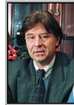
ПРЕЗИДЕНТ ФЕДЕРАЦИИ ТАНЦЕВАЛЬНОГО СПОРТА РОССИИ Павел Павлович Дорохов