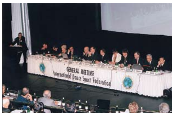
ПЛЕНАРНОЕ ЗАСЕДАНИЕ ГЕНЕРАЛЬНОЙ АССАМБЛЕИ IDSF, Г. МОСКВА, 15 ИЮНЯ 2008 ГОДА