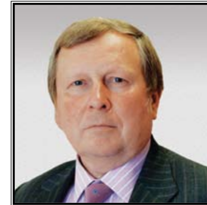
ПРЕЗИДЕНТ ФЕДЕРАЦИИ ФЕХТОВАНИЯ РОССИИ Александр Юрьевич Михайлов

В общероссийскую спортивную общественную организацию «Федерация фехтования России (ФФР)» входят 35 региональных организаций. ФФР признана Международной федерацией фехтования (FIE) и Олимпийским комитетом России (ОКР) единственной организацией, обладающей правом представлять отечественное фехтование во всех государственных органах и общественных организациях России, международном спортивном и олимпийском движении, а также правом координировать развитие фехтования на территории Российской Федерации.