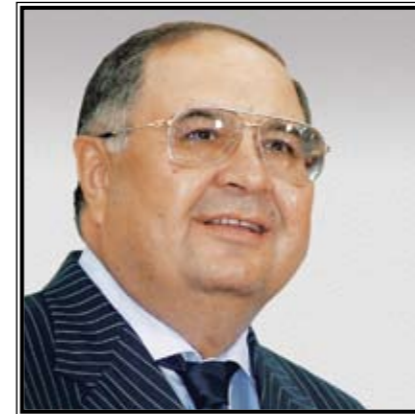
ПРЕЗИДЕНТ МЕЖДУНАРОДНОЙ ФЕДЕРАЦИИ ФЕХТОВАНИЯ Алишер Бурханович Усманов