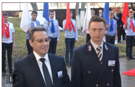
1. ТОРЖЕСТВЕННОЕ ОТКРЫТИЕ МНОГОФУНКЦИОНАЛЬНОГО ЦЕНТРА ПРИКЛАДНЫХ КВАЛИФИКАЦИЙ

Правительством Ставропольского края заключено соглашение о взаимодействии и сотрудничестве с Северо-Кавказской железной дорогой на 2012–2014 годы, в рамках которого руководством ОАО «Российские железные дороги» в 2014 году была проведена модернизация учебно-лабораторной базы колледжа.