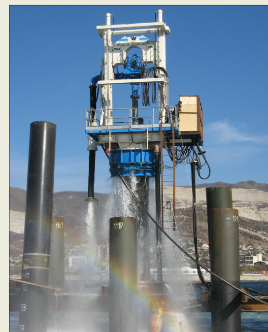
Рабочий процесс строительства Новороссийской военно-морской базы

С особым вниманием в 4-м Главном управлении при Спецстрое России относятся к ветеранам, которые сделали всё возможное, чтобы организация гордилась своей историей. А сегодняшние специалисты пишут новые славные страницы в летопись 4-го Главного управления при Спецстрое России.