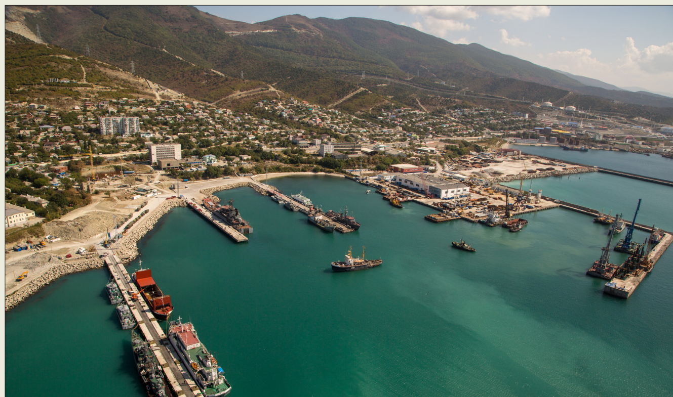
Военная гавань. Сентябрь 2014 года

В настоящее время одним из основных направлений деятельности главка является гидротехническое строительство, в рамках которого специалисты управления создают уникальные сооружения и комплексы военно-