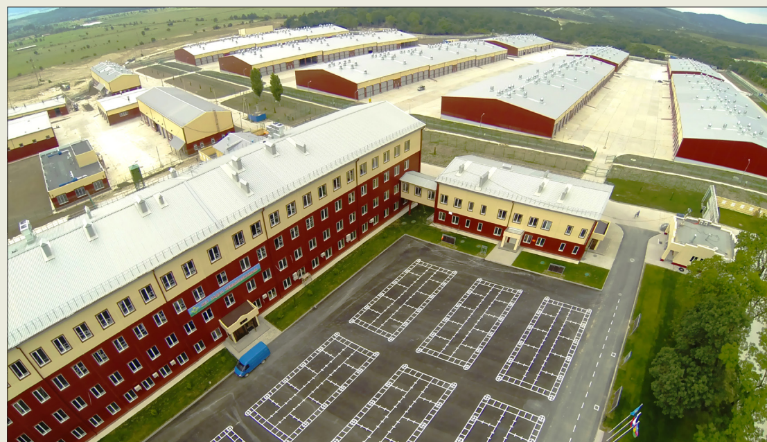
Военный городок на полигоне Расевский