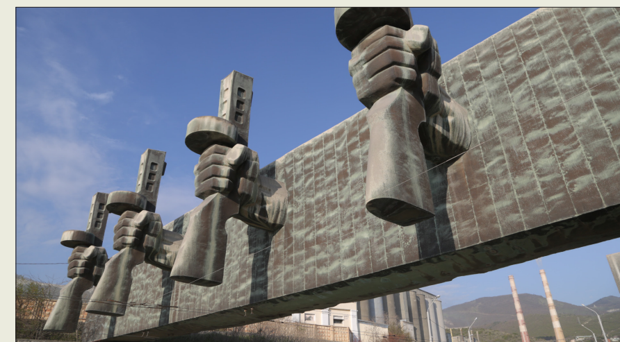
Мемориал «Рубж обороны»

морской базы Черноморского флота в Новороссийске. Президент России В.В. Путин в сентябре 2014 года во время осмотра объектов Новороссийской военно-морской базы высоко оценил работу специалистов 4-го Главного управления.