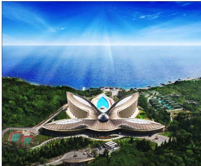
ВИД НА ОТЕЛЬ СВЕРХУ

более 20 профилей, в том числе педиатр, офтальмолог, отоларинголог, уролог, хирург, невролог, кардиолог, гинеколог, стоматолог. Более 100 специалистов среднего персонала – медсестры по физиотерапии, массажисты, косметологи, инструкторы лечебной физкультуры – заняты проведением процедур.