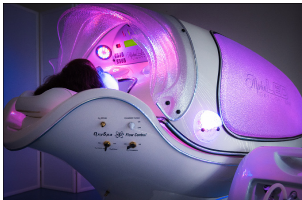
АЛЬФА-КАПСУЛА ДЛЯ СПА-ПРОЦЕДУР