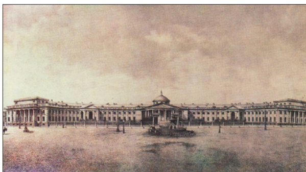
БОГАТОЕ ПРОШЛОЕ – ВЕЛИКОЕ БУДУЩЕЕ