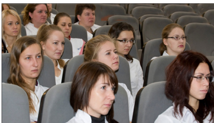
ГОТОВИМ МОЛОДУЮ СМЕНУ

УЧРЕДИТЕЛЬ ИЗДАНИЙ – НИИ СП ИМ. Н.В. СКЛИФОВСКОГО. ЖУРНАЛЫ ВКЛЮЧЕНЫ ВЫСШЕЙ АТТЕСТАЦИОННОЙ КОМИССИЕЙ МИНОБРНАУКИ РОССИИ В ПЕРЕЧЕНЬ РЕЦЕНЗИРУЕМЫХ НАУЧНЫХ ИЗДАНИЙ