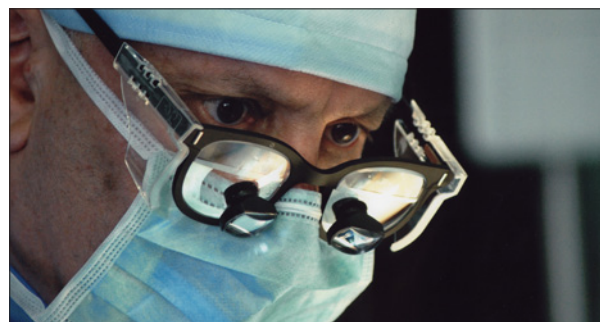
ИДЕТ ОПЕРАЦИЯ ПО ТРАНСПЛАНТАЦИИ ЛЕГКИХ