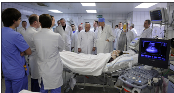
ОБХОД В РЕАНИМАЦИОННОМ ОТДЕЛЕНИИ