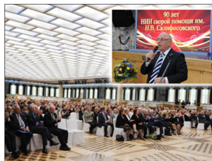
ТРАДИЦИИ И НОВАТОРСТВО

ломного образования и Московского физико-технического института (государственного университета).