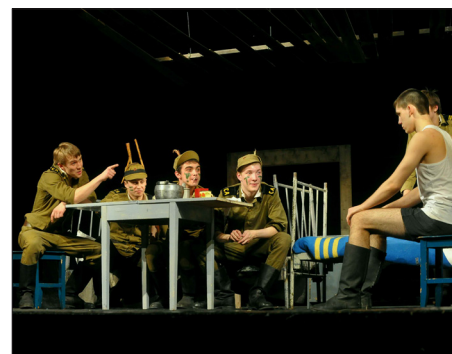
СПЕКТАКЛЬ «ЧМОРИК», КУРС А.И. РУСИНОВА

В программу оптимизации деятельности ЕГТИ в рамках потребностей региона входит проведение семинаров, тренингов, мастер-классов, проектных мастерских, осуществление целевого набора от министерства культуры Свердловской области. В ближайшие годы в ЕГТИ планируется открытие магистратуры и ассистентуры-стажировки по творческим исполнительским специальностям.