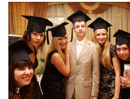
1. СПОРТКЛУБ ЮФУ 2. МАГИСТРЫ

В ЮФУ накоплен значительный опыт подготовки национальных кадров для зарубежных стран. Более 6,3 тыс. иностранных граждан, получивших образование в университете, трудятся в 118 странах дальнего зарубежья. По числу выпускников-иностранцев ЮФУ входит в число ведущих университетов России.