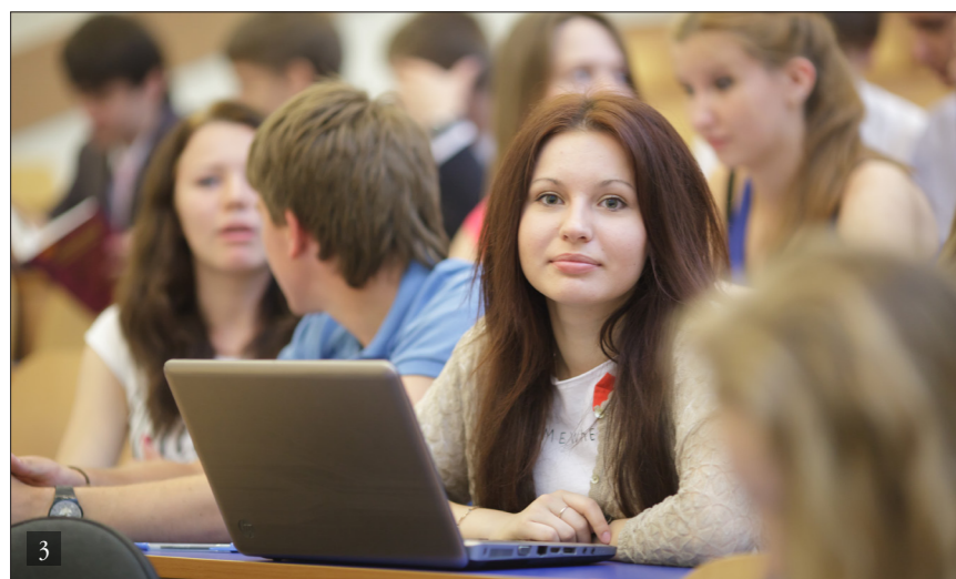
3. СТУДЕНТЫ В АУДИТОРИИ 4. У ИНФОРМАЦИОННОЙ СТОЙКИ В УНИВЕРСИТЕТЕ

ные ресурсы, IT-технологии, позволяющие оперативно обновлять учебный контент. Исходя из этих идеологических предпосылок, МЭСИ ведет активную работу по созданию smart-учебников. Это комплексный учебный материал, создаваемый и обновляемый на основе использования технологических инноваций и интернет-ресурсов и содержащий систематическое изложение знаний в предметной области. Некоторое время назад преподаватели МЭСИ презентовали первый в России smart-учебник по марке-