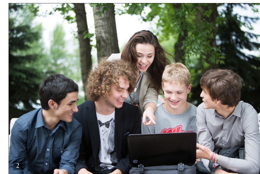
1. ГЛАВНЫЙ ВХОД В УНИВЕРСИТЕТ 2. СТУДЕНТЫ В СВОБОДНОЕ ВРЕМЯ

информационно-коммуникационных технологий уже по достоинству оценены. По результатам опроса 354 менеджеров, проведенного в 2012 году «Мираполис» и Moscow Business School, 24% компаний используют форумы для обмена опытом и знаниями; 12% компаний используют блоги первых лиц или внутрикорпоративных экспертов для трансляции персоналу важной информации; 10% компаний формируют закрытые виртуальные сообщества для поддержки реализации корпоративных проектов.