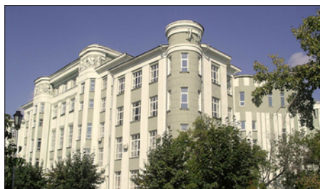
ГЛАВНЫЙ КОРПУС АКАДЕМИИ

Новосибирская государственная академия водного транспорта существует с 1951 года (до 1994 года – Новосибирский институт инженеров водного транспорта). Число курсантов и студентов академии в 2014 году превысило 11 тыс. человек, из них более половины – будущие работники плавсостава. Ежегодная потребность в выпускниках «плавающих» специальностей свыше 1,5 тыс. человек для всех речных бассейнов и крупных морских парокорпусов России. Высокое качество подготовки специалистов в академии обеспечивается в первую очередь квалифицированным педагогическим составом. В настоящее время в академии и ее филиалах научно-педагогическую деятельность по специальностям высшего образования ведут более 500 преподавателей, среди них: 46 академиков и член-корреспондентов общественно-профес-