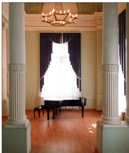
МУЗЫКАЛЬНАЯ ГОСТИНАЯ В ДОМЕ ШУВАЛОВОЙ

Первое гнесинское музыкальное учебное заведение было открыто в Москве на Арбате в 1895 году. Сестры Гнесины и их брат, композитор Михаил Гнесин, мечтали и заботились о новом, демократическом и доступном музыкальном образовании. После 1917 года они передали государству свою музыкальную школу, которая впоследствии стала музыкальным техникумом, а в годы войны сформировался полный комплекс гнесинских учебных заведений; его вершиной стал Государственный музыкально-педагогический институт, любовно названный в народе Гнесинкой. В 1992 году он был переименован в Российскую академию музыки имени Гнесиных, в нынешнем году отмечающую свое 70-летие.