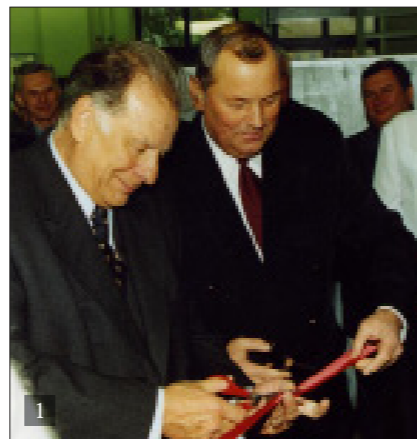
1. ОТКРЫТИЕ ЛАБОРАТОРИИ «ТЕХНИКА ВЫСОКИХ НАПРЯЖЕНИЙ» БНТУ. НА СНИМКЕ – ЛАУРЕАТ НОБЕЛЕВСКОЙ ПРЕМИИ Ж.И. АЛФЁРОВ (СЛЕВА) И РЕКТОР БНТУ Б.М. ХРУСТАЛЁВ (СПРАВА) 2. ПОСЕЩЕНИЕ ВЫСТАВКИ НАУЧНЫХ ДОСТИЖЕНИЙ БНТУ 3. ЗА ЗДОРОВУЮ НАЦИЮ И ПРОЦВЕТАЮЩУЮ БЕЛАРУСЬ

Сегодня, когда многие вузы Республики Беларусь переходят на новую систему обучения – «4 + 2»: 4 года бакалавриата и 2 года магистратуры, – БНТУ был категорически против такого подхода в сфере образования и научно обосновал