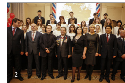
1. ГЛАВНЫЙ КОРПУС РГСУ 2. ТОРЖЕСТВЕННОЕ МЕРОПРИЯТИЕ КО ДНЮ ОСНОВАНИЯ ВУЗА

за счет федерального бюджета, и структура их приема определяются в пределах заданий (контрольных цифр) и устанавливаются ежегодно Минобрнауки России. Постоянно совершенствуются формы работы с аспирантами и докторантами. Разработана система довузовского обучения, дистанционного обучения, переподготовки и повышения квалификации специалистов и руководителей различных органов управления, государственных и муниципальных служащих всех уровней. В центре содействия занятости выпускников предусмотрены: постоянное изучение рынка труда, научно обоснованное прогнозирование ситуации в социально-трудовой сфере, работа с выпускниками вузов Москвы и всей России и работодателями.