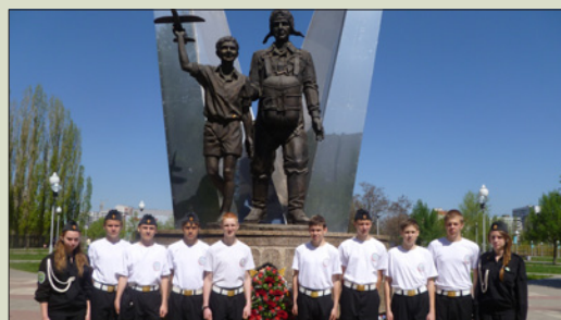
УЧАСТНИКИ КЛУБА «ВИВАТ» У ПАМЯТНИКА ПЕРВЫМ ДЕСАНТНИКАМ-ПАРАШЮТИСТАМ