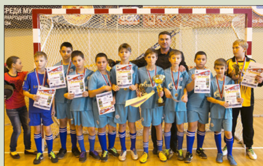
ЮНЫЕ ФУТБОЛИСТЫ ШКОЛЫ

В разные годы наши ученики были участниками и победителями региональных, общероссийских олимпиад по математике, химии, биологии, экологии, всероссийских олимпиад, Соросовской олимпиады школьников, олимпиады «Третье тысячелетие», интернет-олимпиады «Познание и творчество», участвовали во всероссийских проектах «Интеллект-экспресс», «Первые шаги в науку». В школе открыт филиал Общественной Малой академии наук «Интеллект будущего». Став победителями программы школьных обменов для учащихся старших классов, проводимых Американскими Советами по международному образованию, 11 наших ребят в течение года обучались в США.