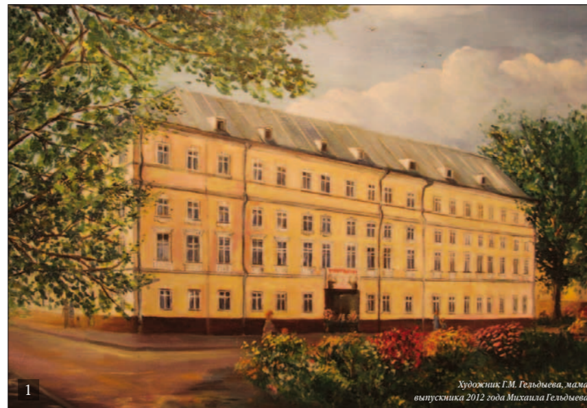
1. Здесь, в этом здании, и проводится работа по развитию образовательной концепции, объединяющей достижения классической педагогики с современными технологиями

Следующая классическая основа – личностно-деятельностный подход, что означает обучение ученика (личности) через деятельность, соответствующую пос-