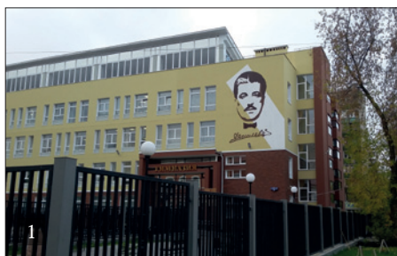
1. НОВОЕ ЗДАНИЕ ГИМНАЗИИ ОТКРЫТО В 2015 ГОДУ 2. МУЗЕЙ-ЛАБОРАТОРИЯ ПО ЭТНОГРАФИИ И РЕМЕСЛАМ РОДНОГО КРАЯ

а также с зарубежными музеями, в том числе с Музеем Виктории и Альберта в Лондоне, художественным музеем в Хартфорде (США). Укреплены научные и творческие контакты с высшими учебными заведениями не только Пермского региона, но и всей России и Европы. В гимназии реализован эффективный принцип: развивать серьезную, академически значимую научную работу с участием детей. Гимназия поддерживает устойчивые научные связи с учеными ведущих пермских вузов, известными исследовательскими центрами России: Институтом русской литературы РАН, Институтом художественного образования РАО, Центром гуманной педагогики, Йельским университетом (США) и Сорбонной (Франция). Гимназия традиционно выступает организатором и модератором различных научно-практических конференций Урала, Центральной России и зарубежья: молодежных научно-