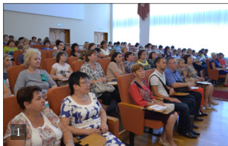
1. КОНФЕРЕНЦИЯ 2. ЭКСПЕРТНЫЙ СОВЕТ

Государственное автономное учреждение дополнительного профессионального образования Липецкой области «Институт развития образования» (далее – ИРО, институт) является связующим звеном в региональной системе непрерывного педагогического образования. Его деятельность связана с осуществлением образовательной, научно-методической, информационной, консультативной, проектной, экспертной, внедренческой функций по актуальным вопросам развития образования. Главная цель ИРО – эффективное научно-методическое сопровождение модернизационных процессов, происходящих в региональной системе образования, работа с педагогическими