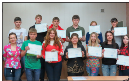
1. НОВОСИБИРСКИЙ ПРОФЕССИОНАЛЬНО-ПЕДАГОГИЧЕСКИЙ КОЛЛЕДЖ 2. ВЫПУСКНИКИ КОЛЛЕДЖА

На каждом историческом этапе становления по мере решения задач расширялись функции колледжа, развивались новые направления базовой и углубленной подготовки специалистов (очная, заочная и дистанционная формы обучения).