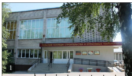
1. ТУЛЬСКИЙ КОЛЛЕДЖ СТРОИТЕЛЬСТВА И ОТРАСЛЕВЫХ ТЕХНОЛОГИЙ. ГЛАВНЫЙ ВХОД 2. КОНКУРСНАЯ ПЛОЩАДКА ПО КОМПЕТЕНЦИИ «СУХОЕ СТРОИТЕЛЬСТВО И ШТУКАТУРНЫЕ РАБОТЫ»

В целях обеспечения качественного партнерства в области подготовки кадров для предприятий легкой промышленности Тульской области колледж участвует в программе взаимного сотрудничества с предприятиями швейной и трикотажной отрасли по организации профессиональной ориентации школьников. Проведение специаль-