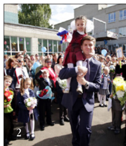
2. ДЕНЬ ЗНАНИЙ