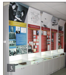
3. МУЗЕЙ БОЕВОЙ И ТРУДОВОЙ СЛАВЫ

Музей боевой и трудовой славы средней школы №36 занесен в Книгу почета Всероссийской организации ветеранов, удостоен звания «Лучший школьный музей», в 2011 году награжден премией Губернатора Ярославской области в сфере образования за опыт «Школьный музей как образовательная среда».