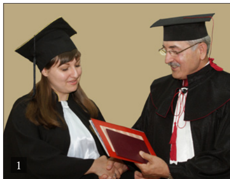
1. ВРУЧЕНИЕ ДИПЛОМОВ 2. РОСТОВСКИЙ ГОСУДАРСТВЕННЫЙ ЭКОНОМИЧЕСКИЙ УНИВЕРСИТЕТ (РИНХ)

Университет заключил договоры о стратегическом партнерстве с Правительством и Торгово-промышленной палатой Ростовской области, Союзом работодателей Ростовской области, бизнес-сообществом юга России. В 2015 году РГЭУ (РИНХ) в составе консорциума 9 университетов Германии, Казахстана, России, Швеции, Эстонии успешно принял участие в первом конкурсе новой объеди-