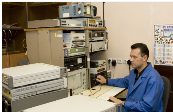
МЕТРОЛОГИЧЕСКАЯ ЛАБОРАТОРИЯ ФБУ «ТЕСТ-С.-ПЕТЕРБУРГ»

ляет предприятиям Санкт-Петербурга и Ленинградской области на льготных условиях получать право маркировать свою продукцию европейским сертификационным знаком СЕ, дающим возможность выхода на рынки Евросоюза. Тесные международные связи существенно увеличивают возможности организации.