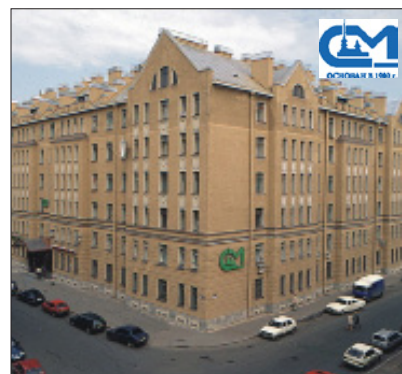
ЗДАНИЕ ФБУ «ТЕСТ-С.-ПЕТЕРБУРГ»

логических сбоях, медицинское оборудование будет показывать врачу правильные данные о здоровье пациента. В быту точно работающий квартирный счетчик позволит не переплачивать за коммунальные услуги.