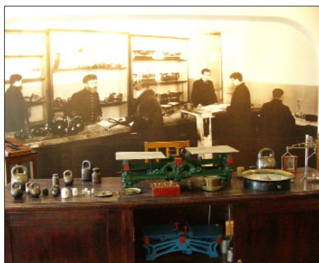
ПЕРВАЯ ПОВЕРОЧНАЯ ПАЛАТКА – РЕКОНСТРУКЦИЯ В МУЗЕЕ ИСТОРИИ ФБУ «ТЕСТ-С.-ПЕТЕРБУРГ»