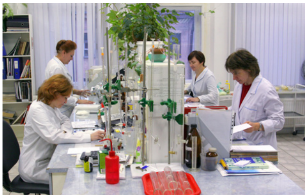
ИСПЫТАТЕЛЬНАЯ ЛАБОРАТОРИЯ ФБУ «ТЕСТ-С.-ПЕТЕРБУРГ»