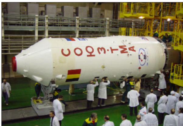
НАКАТКА ГОЛОВНОГО ОБТЕКАТЕЛЯ

Новая система автономной регистрации и запоминания информации на корабле имеет меньшую массу и габариты, а также обеспечивает запись речевой информации.