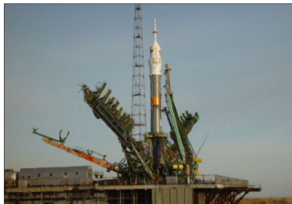
УСТАНОВКА РАКЕТЫ-НОСИТЕЛЯ «СОЮЗ-ФГ» С КОСМИЧЕСКИМ КОРАБЛЕМ «СОЮЗ ТМА» НА СТАРТОВУЮ ПЛОЩАДКУ

торов кресел (четыре режима), что привело к снижению ударных нагрузок в момент посадки СА; – внедрен модернизированный пульт космонавтов «Нептун-МЭ» с новым программным обеспечением, что позволило увеличить объем информации, предоставляемой экипажу, повысить надежность пульта за счет аппаратного дублирования вывода информации.