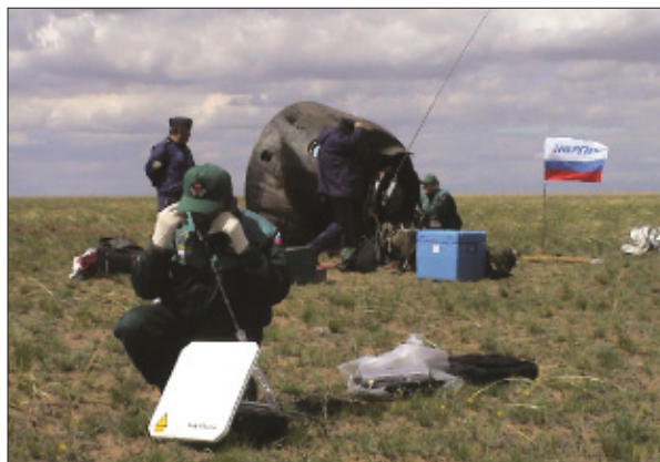
СПУСКАЕМЫЙ АППАРАТ КОРАБЛЯ «СОЮЗ ТМА» НА МЕСТЕ ПОСАДКИ

казом переход на запасную парашютную систему. Для этого основной купол ОСП был зарифован (стянут шнуром по кромке купола). Автоматика системы приземления зафиксировала повышенную скорость, отделила купол ОСП и ввела в действие запасную парашютную систему.