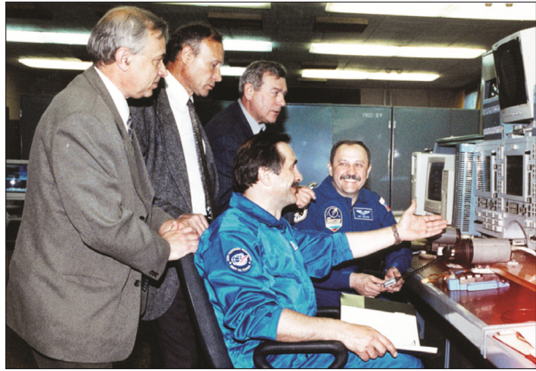
ТЕСТИРОВАНИЕ НОВОГО ПУЛЬТА КОСМОНАВТОВ

ческой перегородкой и запускаются автономно. В зависимости от массы СА при спуске на основной парашютной системе (ОСП) или в зависимости от вида отказа ОСП автоматика системы приземления выдает команды на запуск необходимых секций. Возможность запуска ДМП-М в различных режимах обеспечивает выдачу двигателями импульса, в большей степени соответствующего состоянию СА и параметрам его движения на момент посадки. На СА корабля «Союз ТМА» было установлено два ДМП-М с секционированным зарядом.