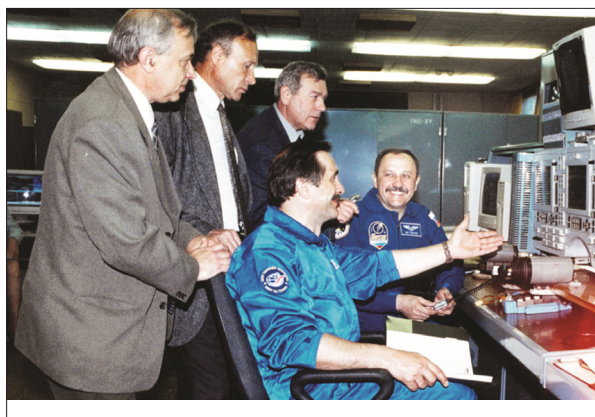
ПРИМЕРКА ЭКИПАЖА В КРЕСЛЕ «КАЗБЕК-УМ»

ность функционирования бортовых систем и средств приземления.