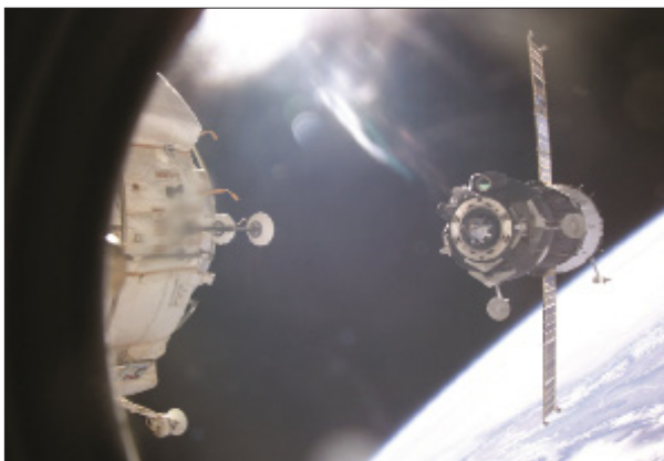
СТЫКОВКА КОРАБЛЯ «СОЮЗ ТМА» С МЕЖДУНАРОДНОЙ КОСМИЧЕСКОЙ СТАНЦИЕЙ

После динамических испытаний в середине марта 1998 года на макете СА проводились контрольные примерки размещения внутри него экипажей с предельными антропометрическими данными. Проверялись размещение космонавтов, операции взведения кресел и наддува скафандров, досягаемость органов ручного управления, имитировалась работа с ними.