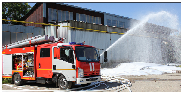
ИСПЫТАНИЕ ПОЖАРНОГО АВТОМОБИЛЯ АЦ 1,5-40/2 (ISUZU NQR90L) С УСТАНОВКОЙ КОМПРЕССИОННОЙ ПЕНЫ