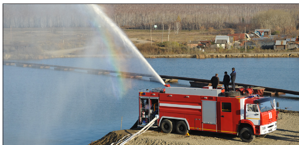
ИСПЫТАНИЕ МОЩНОЙ НАСОСНОЙ УСТАНОВКИ ПОЖАРНОГО АВТОМОБИЛЯ АЦ 10,0-150 (КАМАЗ-65225) ПРОИЗВОДСТВА ООО «УСПТК-ХОЛДИНГ»