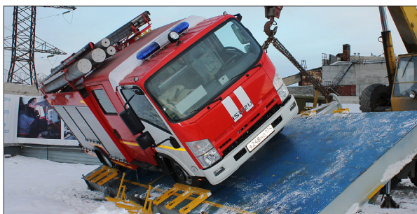
ИСПЫТАНИЕ ПОПЕРЕЧНОЙ УСТОЙЧИВОСТИ АВТОМОБИЛЯ

жарно-технического вооружения и аварийно-спасательного инструмента, укомплектовав их тем оборудованием, которое действительно необходимо для выполнения задач по назначению, снизив стоимость пожарных автомобилей;