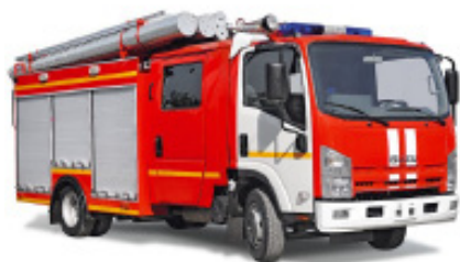
АВТОЦИСТЕРНА ПОЖАРНАЯ АЦ 1,5-40/2 (ISUZU NPR75L)