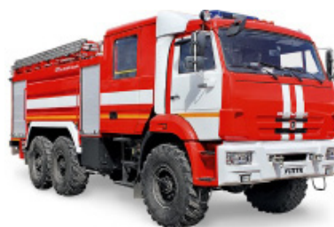
АВТОЦИСТЕРНА ПОЖАРНАЯ АЦ 7,0-70 (43118)