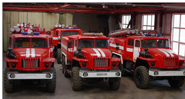
В ЦЕХЕ ЗАВОДА ООО «УСПТК-РМЗ»

достаточно иметь аварийно-спасательный инструмент на вооружении одного из отделений караула.