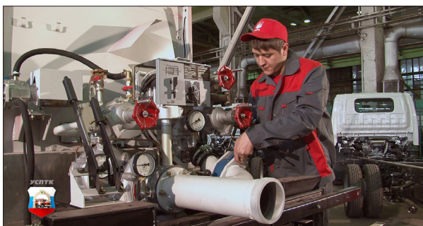
УСТАНОВКА ПОЖАРНОГО НАСОСА СОБСТВЕННОЙ РАЗРАБОТКИ