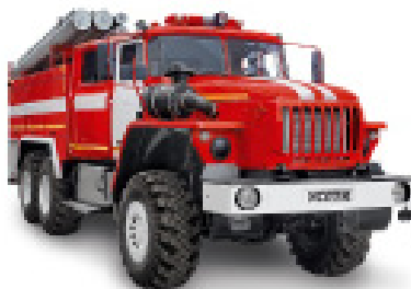
АВТОЦИСТЕРНА ПОЖАРНАЯ АЦ 5,5-40 (5557)