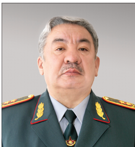
Нурлан Айтманович Джуламанов

ЗАМЕСТИТЕЛЬ ПРЕДСЕДАТЕЛЯ КОМИТЕТА НАЦИОНАЛЬНОЙ БЕЗОПАСНОСТИ РЕСПУБЛИКИ КАЗАХСТАН – ДИРЕКТОР ПОГРАНИЧНОЙ СЛУЖБЫ, ГЕНЕРАЛ-ЛЕЙТЕНАНТ