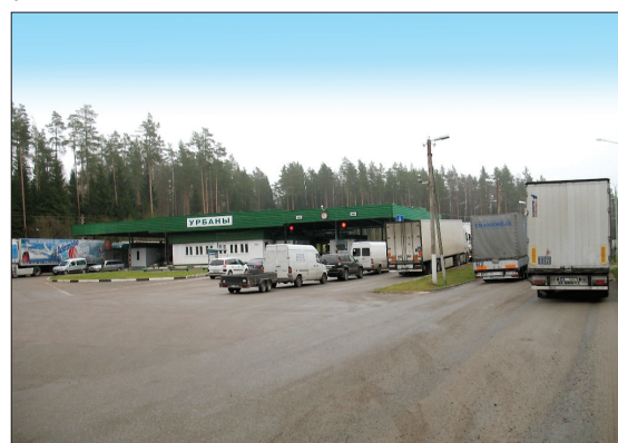
1–2. Обустройство границы 3–4. Пограничный контроль 5–6. Международный автодорожный пункт пропуска Урбаны