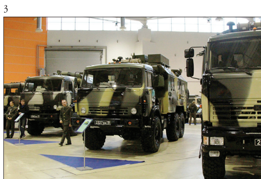
1–6. Международная выставка «Интерполитех-2012»

поставки, охватывающий весь процесс планирования и размещения гособоронзаказа: от получения номенклатуры и подготовки документации о торгах до заключения контрактов и формирования аналитических отчетов. Данная система позволит в перспективе свести к минимуму влияние человеческого фактора в работе, повысить производительность труда и управляемость процессом размещения ГОЗ на всех его стадиях.