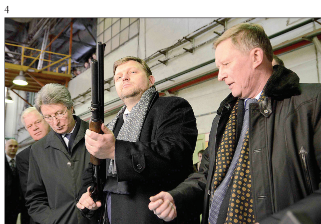
1–5. В 2011 году вице-премьер С.Б. Иванов посетил цеха ОАО «Вятско-Полянский машиностроительный завод «Молот»