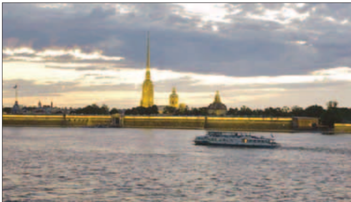
14. Белые ночи на Неве

15. Координатор Промышленного совета Санкт-Петербурга С.Д. Бодрунов, заместитель Министра промышленности и торговли Российской Федерации Д.В. Мантуров и генеральный директор Государственной корпорации «Ростехнологии» С.В. Чемезов