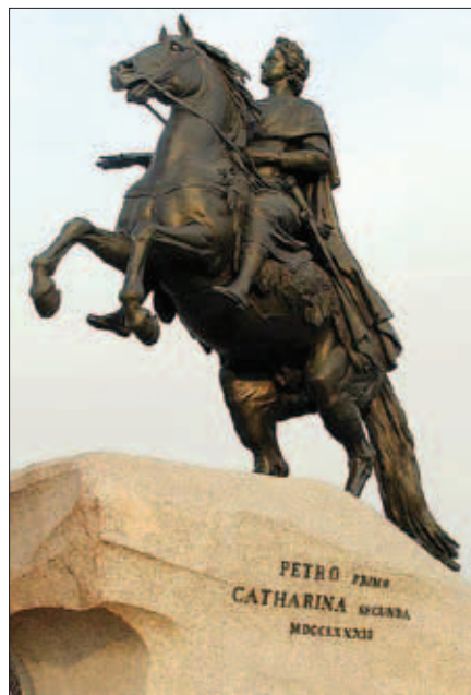
8. Медный всадник

лению общественных ресурсов, либо как о вороватом чиновнике, распределяющем ресурсы. Изменить такие представления, далеко не всегда справедливые, но имеющие право на существование и постоянно воспроизводимые в общественном сознании по объективной причине, каковой является нынешнее экономическое устройство, унаследовавшее результаты реформ 1990-х, является одной из важнейших задач модернизации российского общества.