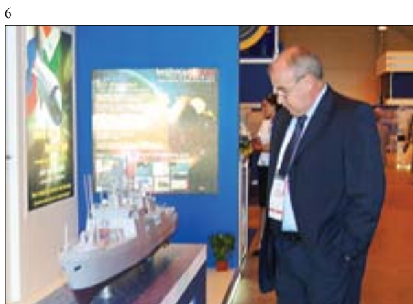
5–7. Международный форум «Технологии в машиностроении», 2010 год