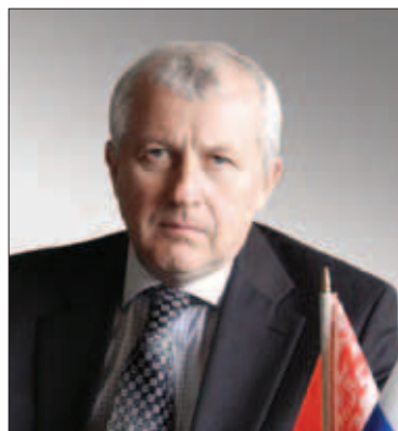
Александр Николаевич Корсаков

ПРЕДСЕДАТЕЛЬ ГОСУДАРСТВЕННОГО ПОГРАНИЧНОГО КОМИТЕТА РЕСПУБЛИКИ БЕЛАРУСЬ