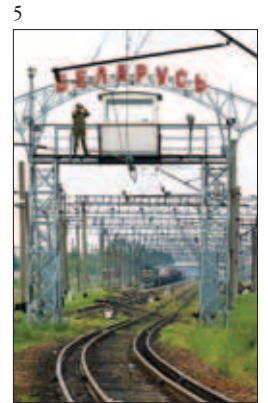
1–5. Охрана границ Союзного государства в надежных руках