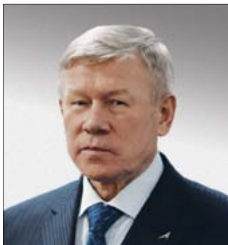
Анатолий Николаевич Перминов

РУКОВОДИТЕЛЬ ФЕДЕРАЛЬНОГО КОСМИЧЕСКОГО АГЕНТСТВА