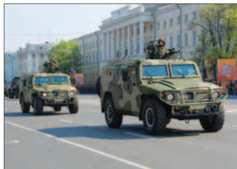
8–13. Парад Победы в Нижнем Новгороде. 2010 год

строительную отрасль. В рамках этой работы между правительствами Нижегородской области и Санкт-Петербурга подписан протокол о сотрудничестве в сфере разработки и производства кораблей с динамическими принципами поддержания. Появление отраслевой ассоциации должно создать более благоприятные условия для работы нижегородских судостроителей.