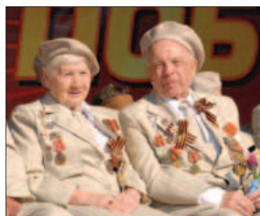
3. Военная техника на территории Нижегородского Кремля 4–7. Парад Победы в Нижнем Новгороде. 2010 год

Наша кадровая политика не исчерпывается только подготовкой кадров. Важна также реализация социальных и жилищных программ по оказанию помощи молодым специалистам ОПК в приобретении жилья. В настоящее время в Нижегородской области такие программы реализуются через фонд «Доступное жилье». К примеру, проект «Яблоневый сад» позволит в 2011–2012 годах построить коттеджный поселок из 247 домов для молодых специалистов РФЯЦ-ВНИИЭФ в Сарове.